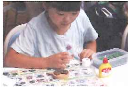
自然素材のクラフト