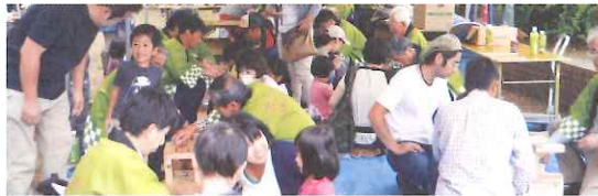
親子木工教室(小学生、イス作り)