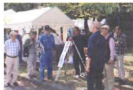
測量体験とパステル画