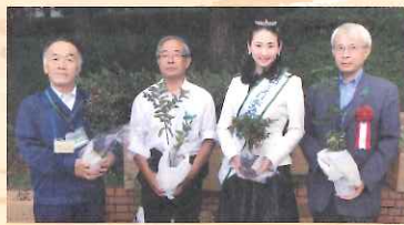
苗木プレゼント (数量限定、スタンプラリー制)