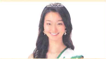
「ミス日本 みどりの女神」来場