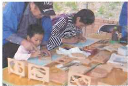
ミニ欄間彫り体験(有料)