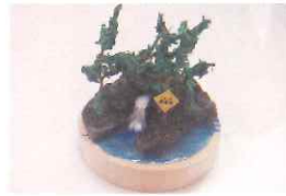
水源の森ジオラマづくり