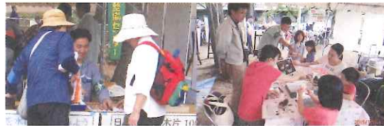
森林にまつわる研究体験