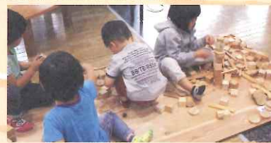
木と遊ぶキッズコーナー

主催: 水都おおさか森林づくり・木づかい実行委員会 協賛: 一般財団法人日本森林林業振興会大阪支部 / 一般社団法人全国燃料協会 後援: 国土交通省近畿地方整備局 / 近畿地方環境事務所 / 近畿農政局 / 三重県 / 滋賀県 / 京都府 / 奈良県 / 和歌山県 / 大阪市 / 大阪市教育委員会 / 滋賀県森林組合連合会 / 京都府森林組合連合会 / 奈良県森林組合連合会 / 和歌山県森林組合連合会 / 滋賀県木材協会 / 一般社団法人京都府木材組合連合会 / 奈良県木材協同組合連合会 / 兵庫県木材協同組合連合会 / 和歌山県木材協同組合連合会 / 内閣府公益社団法人大阪府協会 / 公益社団法人国土緑化推進機構 / 公益財団法人関西・大阪21世紀協会 / 公益財団法人国際花と緑の博覧会記念協会 / 帝国ホテル 大阪 / 産経新聞大阪本社 / 森林環境の保全・整備連絡調整会