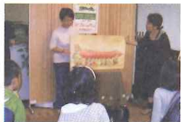
大型絵本の読み聞かせ