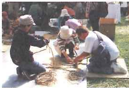
つるかご編み(有料)