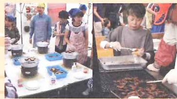
森の食材を活かしたフードコーナー