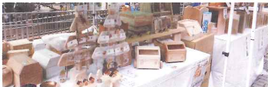
木のおもちゃ、イス、まな板、アクセサリなど木製品の販売